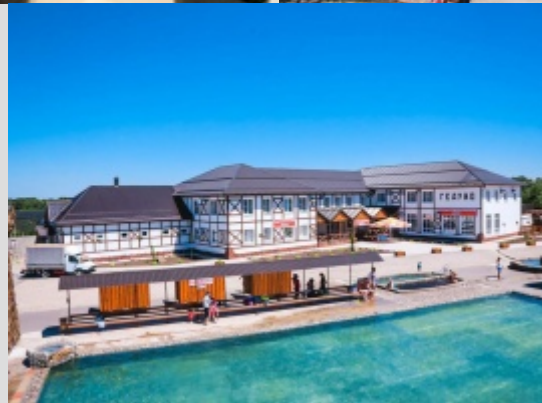
Возвращение в гостиницу. Свободное время. Ночлег.